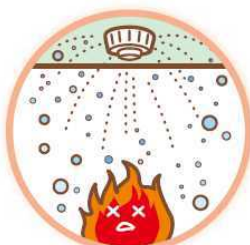
スプリンクラー設備