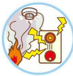
自動火災報知設備